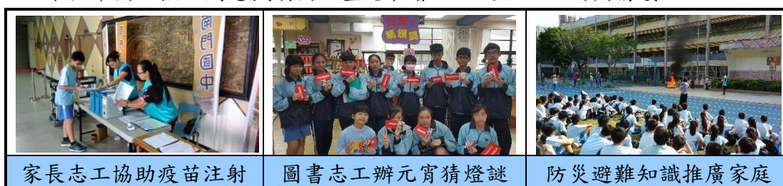
家長志工協助疫苗注射