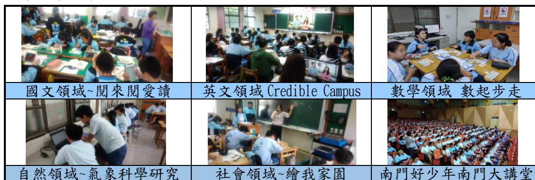
國文領域~閱來閱愛讀

面臨 108 新課綱推動實施，本校各領域主動申請撰寫彈性課程計畫，以創新本位及符合素養導向為原則，透過專家指導、領域共備，已完成 108 學年度七年級彈性課程。