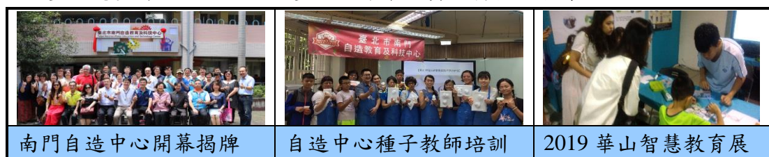
南門自造中心開幕揭牌