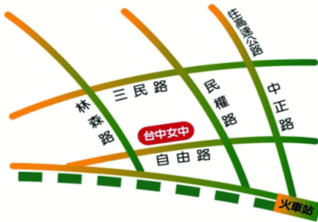
臺中市立臺中女子高級中等學校 110 學年度校園配置圖