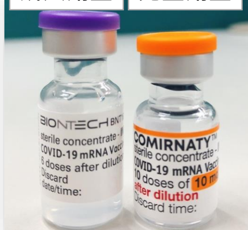
成人劑型 兒童劑型